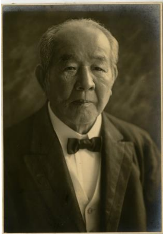
渋沢栄一写真（個人蔵）