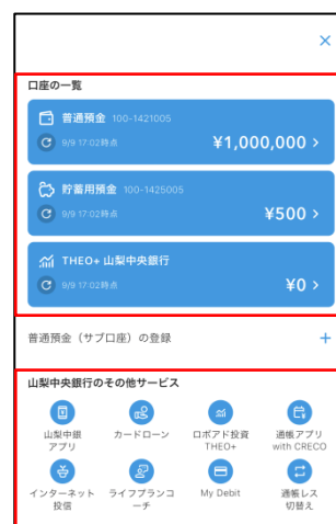
お金のメニュー画面