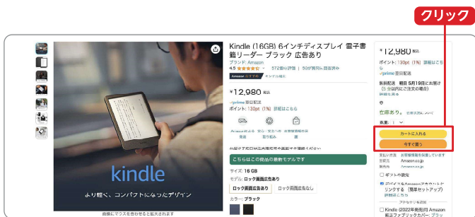
ショッピングページ

Amazonサイト内で欲しい商品を見つけたら、数量を選択して「カートに入れる」あるいは「今すぐ買う」をクリック。