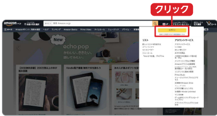
Amazonサイトトップページ

ブラウザに「アマゾン」と入力し検索、または「http://www.amazon.co.jp/」と直接打ち込み、Amazonのサイトを開く。右上の「こんにちは。ログインアカウント&リスト」にカーソルを合わせ「新規登録はこちら」をクリック。